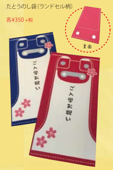
たとうのし袋(ランドセル柄)