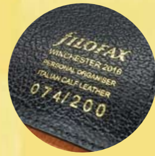
シリアルナンバー入り!