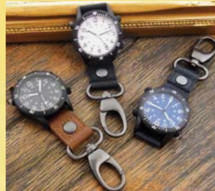
▲本体色は左から茶、黒、ネイビーの3種類

横43×縦126×厚み16mm 使用電池: 時計用/リチウム電池(SR626SW) 1個 LED用/リチウム電池(CR2016) 2個